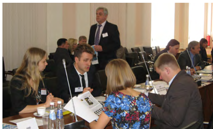
Uzņēmēji no Latvijas un Krievijas tiekas kontaktbiržā Pleskavā

Vizītes ietvaros Latvijas uzņēmēji piedalījās Apvienotā Reģionālā Tehniskā sekretariāta sadarbībai ar Eiropas Savienību – ARTES (Eiropas Mājas) atklāšanā Ostrovā. Tā mērķis ir veicināt sadarbību starp Latvijas un Krievijas Ziemeļrietumu apgabala pašvaldībām, to organizācijām, nevalstiskām organizācijām, komercstruktūrām un iedzīvotājiem, lai īstenotu kopīgus projektus un attīstītu ekonomisko sadarbību