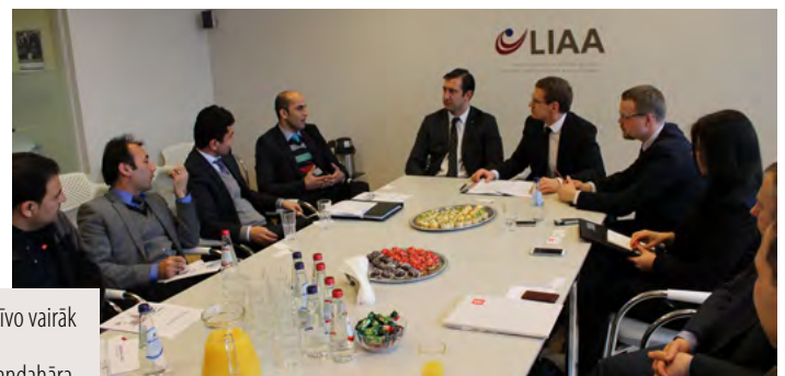
Apalā galda diskusijas dalībnieki diskutē par iespējamajiem sadarbības virzieniem

Apalā galda diskusijas dalībnieki bija vienprātīgi, ka pastāv virkne nozaru, kurās ir iespējama reāla sadarbība, it īpaši – telekomunikāciju jomā, infrastruktūras atjaunošanas darbos (gan projektēšanas, gan būvniecībā) un pārtikas nozarē.