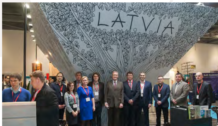
Latvijas vēstnieks Lielbritānijā Andris Teikmanis kopā ar Latvijas nacionālā stenda dalībniekiem

Vairāk nekā 1400 dalībnieku ~ 45 000 apmeklētāju no vairāk nekā 120 valstīm 8 dalībnieki no Latvijas katram 4 - 8 kontakti ar potenciālo darījumu pazīmēm