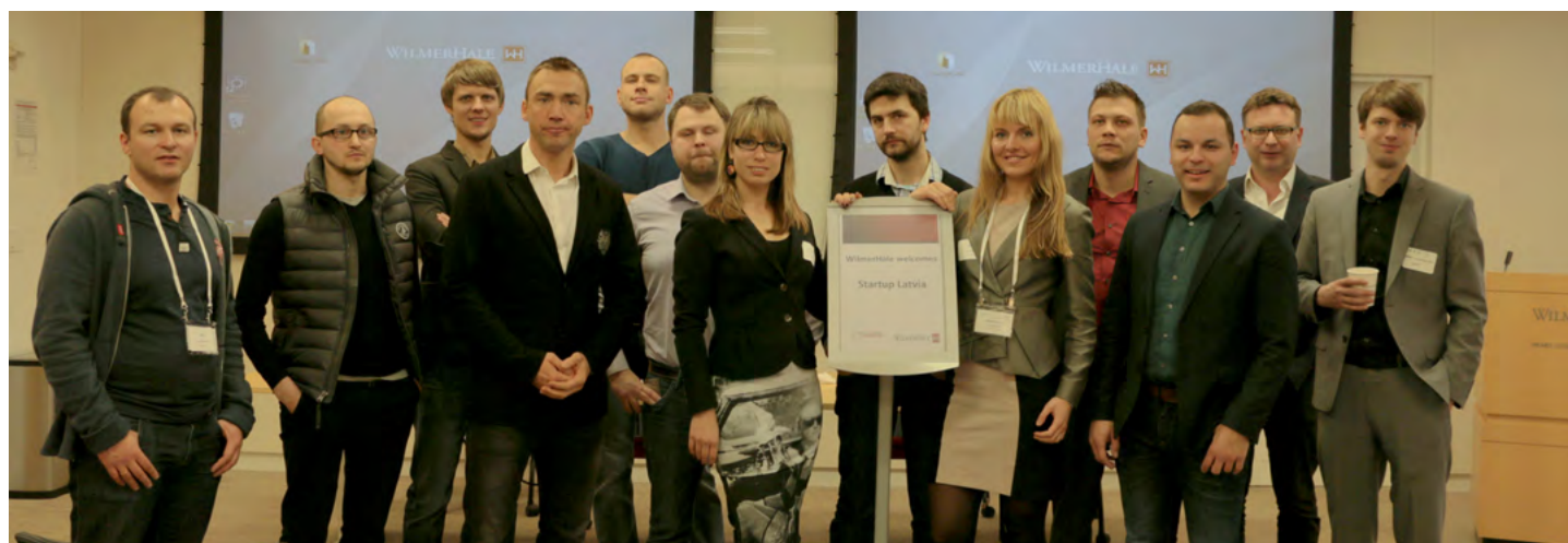
Latvijas uzņēmēji vienā no pasaulē un Silīcija ielejā zināmākajiem jurisprudences uzņēmumiem „Wilmer Hale”