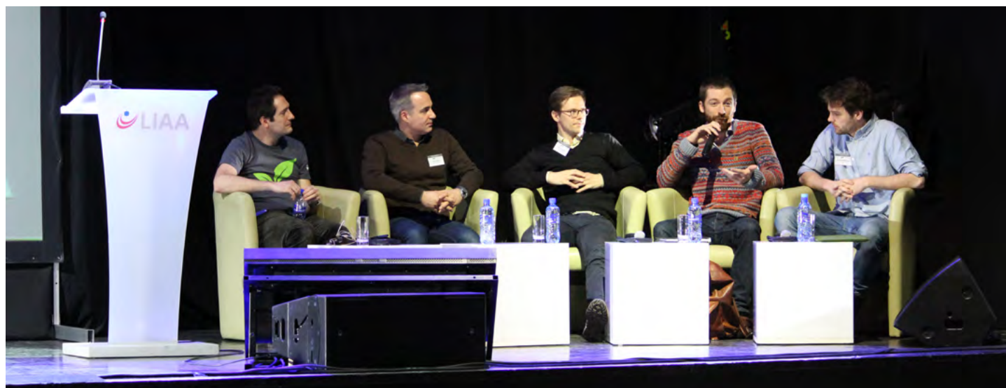
Semināra „Mini Seedcamp” žūrija vērtē start-up prezentācijas

Gada pirmajos trīs mēnešos Ekonomikas ministrija sadarbībā ar LIAA, novada domēm (Liepājas domi – Liepājā, Saldus novada domi – Saldū), Latvijas Garantiju aģentūru, Latvijas Attīstības finanšu institūciju ALTUM un Kurzemes plānošanas reģiona ES struktūrfondu informācijas centru organizējušas forumus „ Atbalsts uzņēmējiem ”, lai esošajiem un topošajiem uzņēmējiem sniegtu informāciju par aktuālajiem atbalsta instrumentiem, atbalsta programmām un ES fondu finansējumu uzņēmējdarbībai 2014. - 2020. gadā. Ar eksporta uzsākšanas un attīstīšanas teorijas niansēm un praktiskiem piemēriem uzņēmēji iepazīstināti Eksporta darbnīcās , kas notikušas Gulbenē un Liepājā.