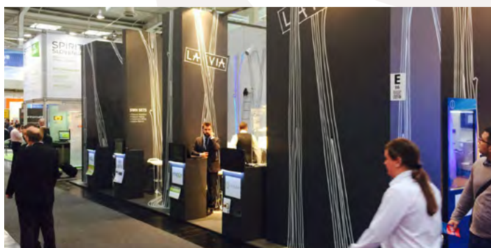
Latvijas nacionālā stenda vienkāršais un vienlaikus pamanāmais dizains pozitīvi novērtēts stenda dalībnieku un apmeklētāju vidū

Šajā gadā izstāde „CeBIT” notika tikai darba dienās (no 10. līdz 14. martam), tādējādi vairāk ļaujot koncentrēties uz B2B risinājumiem. Lai iepazītu nozares aktualitātes un iegūtu jaunus un perspektīvus biznesa kontaktus, uzņēmēji varēja piedalīties dažādu nozaru konferencēs un semināros.