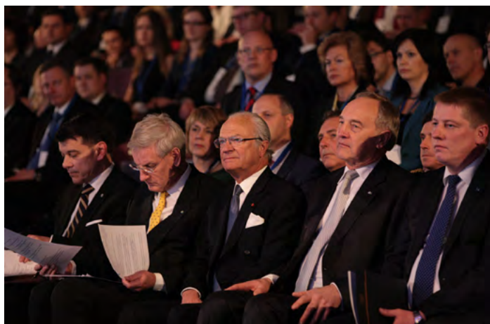
Priekšplānā (no kreisās puses): Zviedrijas karalis Kārlis XVI Gustavs, Latvijas Valsts prezidents Andris Bērziņš un satiksmes ministrs Anrijs Matīss Zviedrijas - Latvijas biznesa forumā