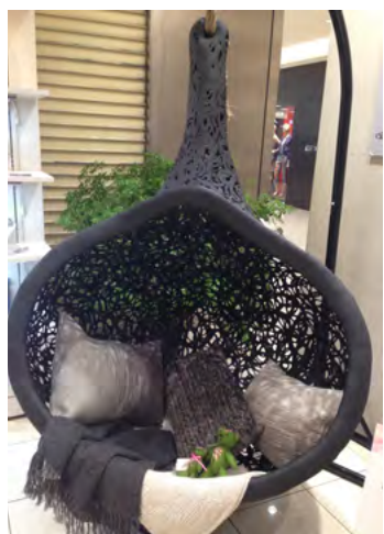
Latvijas preču prezentācija universālveikalā Tokijā

LIAA pārstāvniecība Japānā sadarbībā ar galeriju - veikalu „Athalie” organizēja divus Latvijas preču prezentācijas pasākumus Japānas vadošajos universālveikalos „Hankyu Umeda” Osakā (no 26. līdz 31. martam) un „Tokyu Shibuya Honten” Tokijā (no 1. līdz 9. aprīlim).