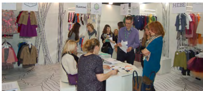
Bērnu apģērbu ražotāji no Latvijas LIAA organizētajā nacionālajā stendā „CPM” izstādē Maskavā

Uz Krieviju, kas ir viena no Latvijas svarīgākajiem tirdzniecības partneriem tekstila nozarē, februārī devās Latvijas ražotāji, lai piedalītos vienā no nozīmīgākajām nozares izstādēm – „CPM”. Tā notiek divas reizes gadā, un izstādes laikā iepircēji izvēlas un iepērk jaunās kolekcijas. Izstāde ir svarīgākais un prestižākais notikums modes jomā ne tikai Krievijā, bet arī NVS reģionā.