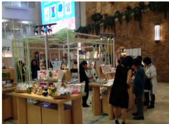
Latvijas produktu stendi universālveikalā Osakā