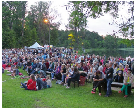
Izdevējs: Ērģļu novada pašvaldība Foto: A. Leitāns, I. Daugiallo, I. Storie, www.ogreskraces.lv Meņģeļu muzeja fotoarhivs, 2020

Ērģļu novads – brīnišķīga vieta, kur dzīvot. Dzīvot vakarā pēc garas darba dienas, brīvdienās pēc mācībām un studijām, atvaļinājumā pēc lielā darba cēliena. Dzīvot novadā, kur rodas idejas jaunam sākumam, radošiem darbiem.