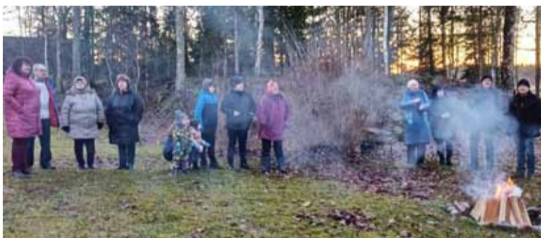
Barikāžu piemiņas pasākuma dalībnieki pie atmiņu ugunsкура Sausnējas pagasta vēstures muzeja pagalmā.

Dainis Ivāns , Latvijas Tautas frontes pirmais priekšsēdētājs: „Barikāžu laika notikumi lauza pasaules vēsturi. Tie uz mūžiem ierakstījušies Latvijas valstiskajā apziņā. Iedomājoties barikādes, reizēm saspringstu no uzdrīkstēšanās toreiz. Cilvēki nāca kailām rokām, sargāja brīvību un demokrātiju. Janvāri vajag atcerēties, jo tas ir viens no Latvijas pašapziņu veidojošiem stūrakmeņiem. Atmodas brīvības ilgās un barikāžu ugunsuros rūdījās ne vien tautas raksturs tā labākajās izpausmēs,