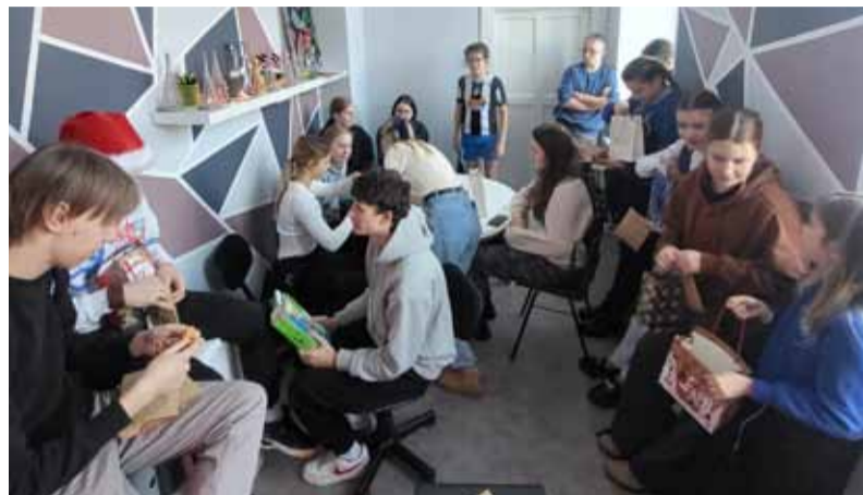
Domes darba kabinetā.

Kas tad ir paveikts šajās jomās? Esam organizējuši Miķeļdienas gatirgu, Popielu „Ērgļu Divstūris”, Ziemassvētku pastu un Ziemassvētku tematisko nedēļu, iesaistot visu Ērgļu vidusskolas saimi. Skolā ir izvietoti divi depoziņa punkti, lai rūpētos par sakoptu vidi un tajā pašā laikā iegūtos līdzekļus izmantotu pasākumu organizēšanai un ideju realizēšanai. Oktobrī pārstāvējām Ērgļu vidusskolu un popularizējām skolas vārdu Ķeipenes skolēnu pašpārvaldes organizētā pasākumā „Ieguldījums Tavā nākotnē”.