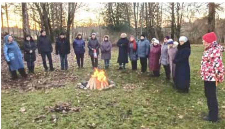
Barikāžu piemiņas pasākuma dalībnieki pie atmiņu ugunsкура Sausnējas pagasta vēstures muzeja pagalmā.

bet dzima kopējais, vārdos neizsakāmais un Satversmē neapprakstāmais priekšstats par Latvijas nākotni. Tādi vienoti, patriotiski, pat svēti kā toreiz mēs labprāt dzīvotu šodien arī sadzīvīgo raižu pasaulē, bet nesamāc.”