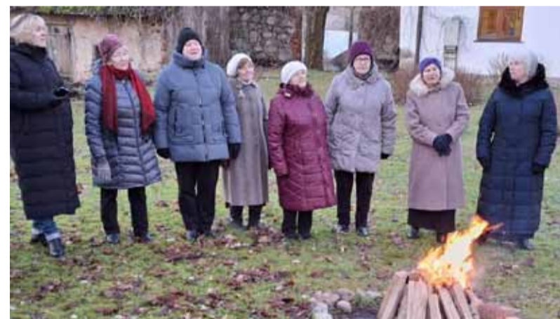
Vestienas pagasta sieviešu vokālais ansamblis „Liepa” uzstājas barikāžu aizstāvju pasākumā Sausnējā.

un vērojot, cik rāmi plīvo uguns liesmas, ikviens atmiņā atsauca arī savas dzīves epizodes. Dziedājām dziesmas par Latvijas dabas skaistumu, darba tikumu un tēvzemes mīlestību.