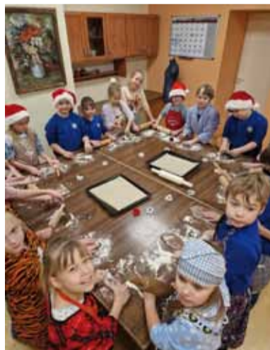
Ziemassvētku smarža skolā 2. kl.

Visas klases izmantoja iespēju izcept piparkūkas. Cepšana bija jautra, jo mazliet pamētajāmies ar miltiem, viens otru noputinājām. Daži skolēni nevarēja sagaidīt, kad gardums izcepsies, tāpēc krietni pagaršoja miklu un pat glazūru. Tā kā visas piparkūkas nebija vienādi biezas izrullētas, kādas pārcepās tumšas, tumšas, bet lielākā daļa bija izdevušās labas. Daži skolēni pagaršoja arī piedegušās.