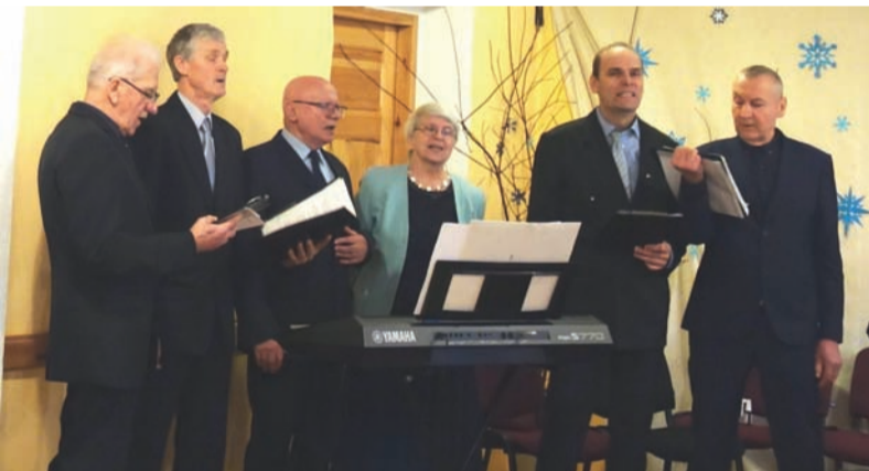
Senioru ballē uzstājas Ķeipenes pagasta vīru vokālais ansamblis.

Ak, gadi, jūs divainie dārgumi, Kāds skaistums ap katru vijas, Gan sniegpārslu baltais mirdzējums, Gan vasaras melodijas.