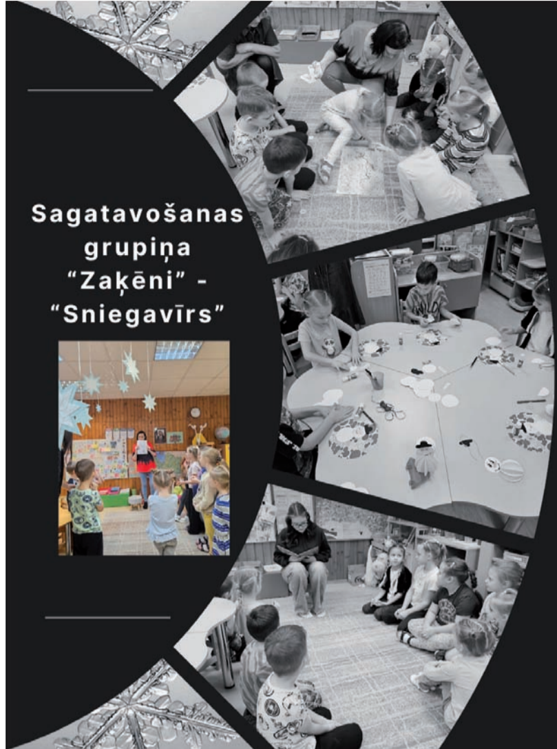
Sagatavošanas grupiņa „Zaķēni” – „Sniegavīrs”