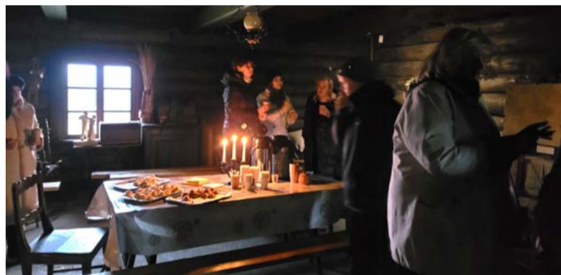
Ciemošanās „Brakos”.